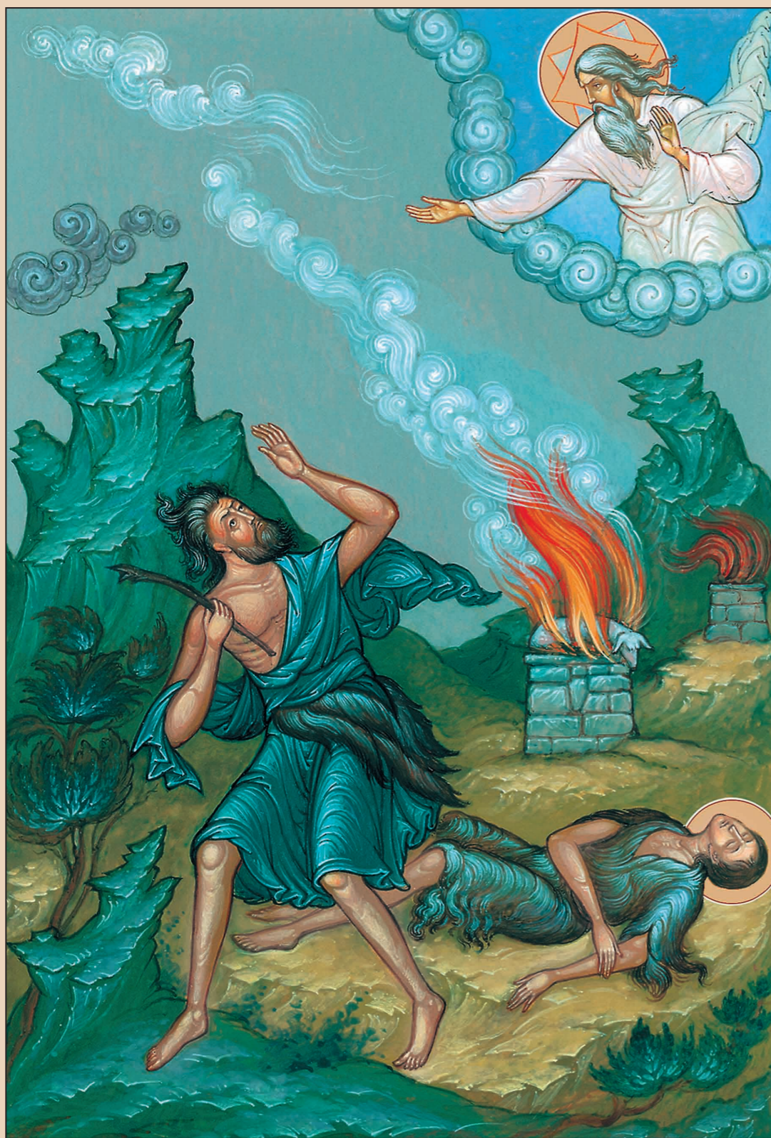
Убийство Каином Авеля

— Нет, ты убил своего брата, и теперь ты нигде не найдёшь себе покоя!