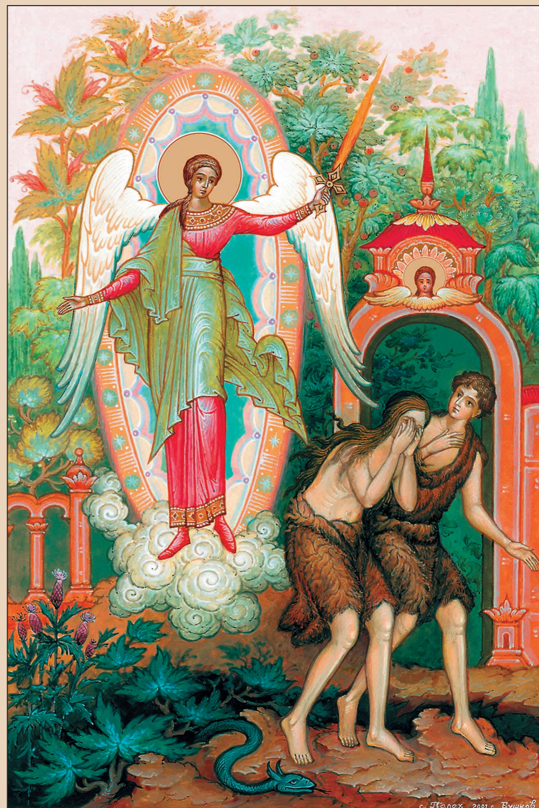
Изгнание из рая

— Я здесь, — ответил он, — но мне стыдно показаться Тебе, Господи, потому что у меня нет одежды!