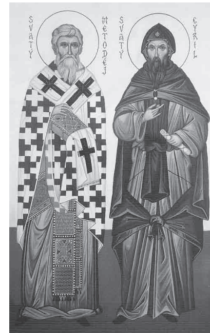
Святые просветители славян Кирилл и Мефодий. Икона

Часть честных мощей Константин и Мефодий, возвращаясь в Константинополь после завершения миссии у хазар, взяли с собой, а святая глава Климента была