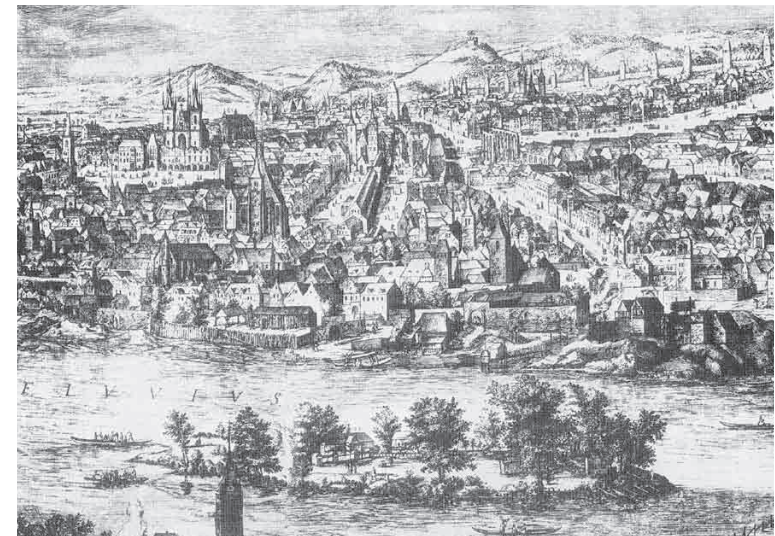
Прага, 1606 год. Гравюра