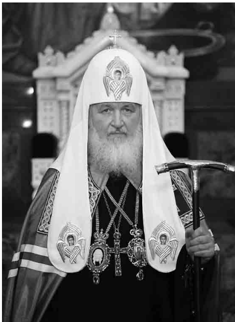
Святейший Патриарх Московский и всея Руси Кирилл

ских, ворвавшихся в их страну на танках с «братской» помощью.