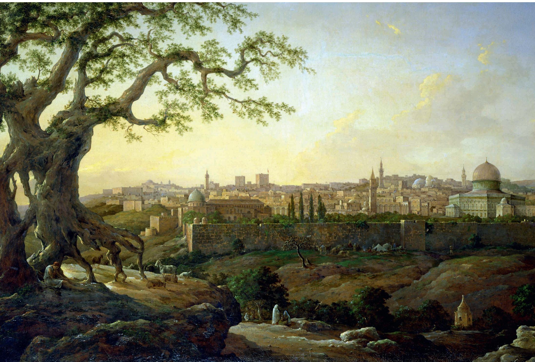
Вид Иерусалима. Н. Г. Чернецов. 1854