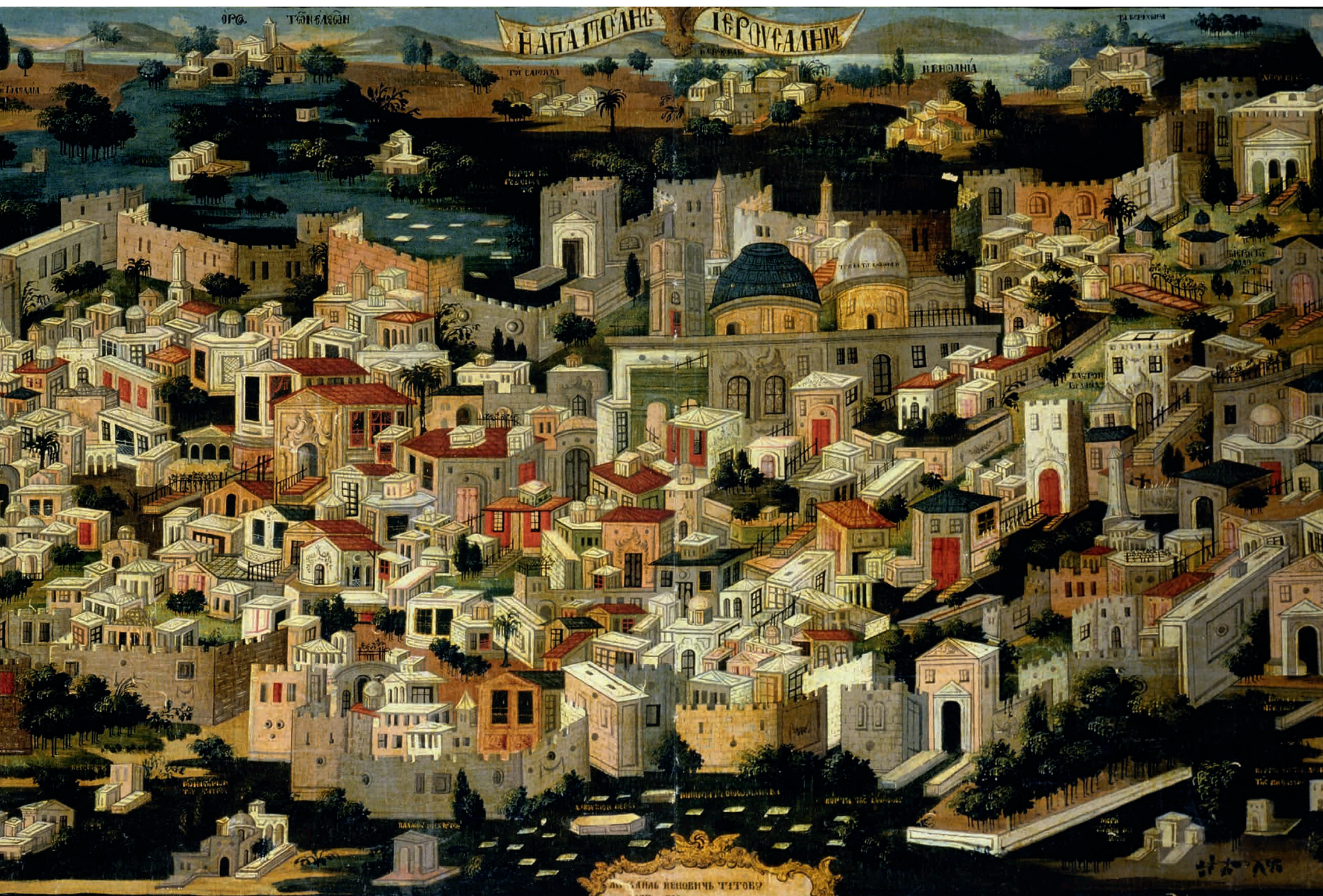
Перспективный вид Палестины с городом Иерусалимом в центре. Неизвестный художник.1833