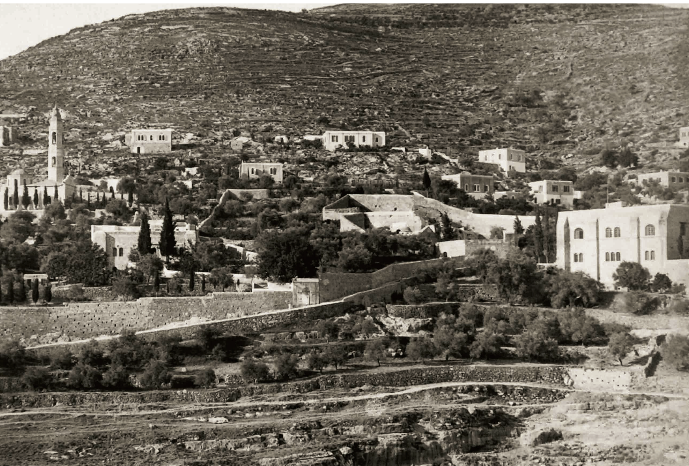
Селение Айн-Карем — русское Горнее. Общий вид. Конец XIX в.