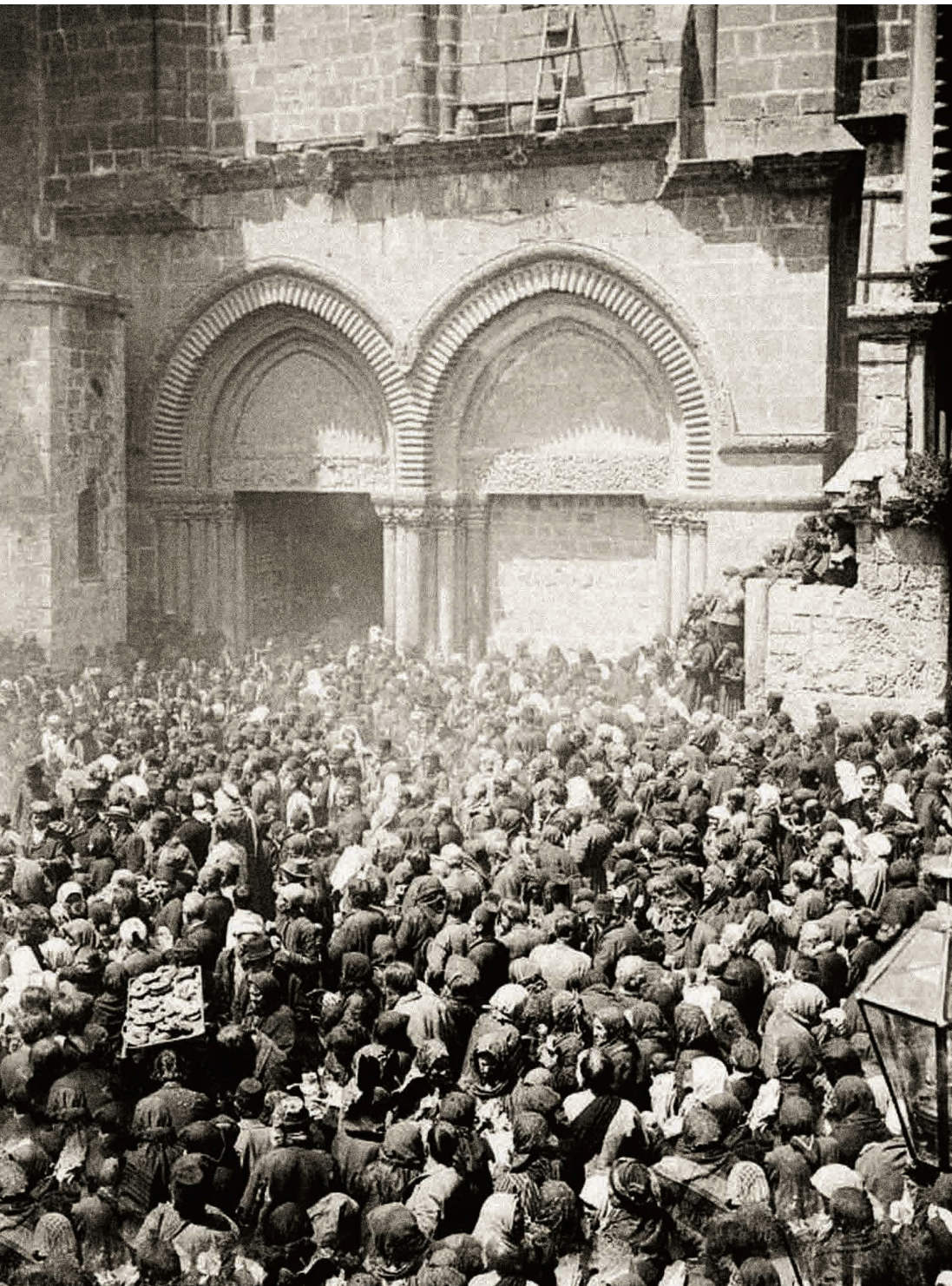
Храм Воскресения Христова в Иерусалиме. Великая Суббота. Конец XIX в.