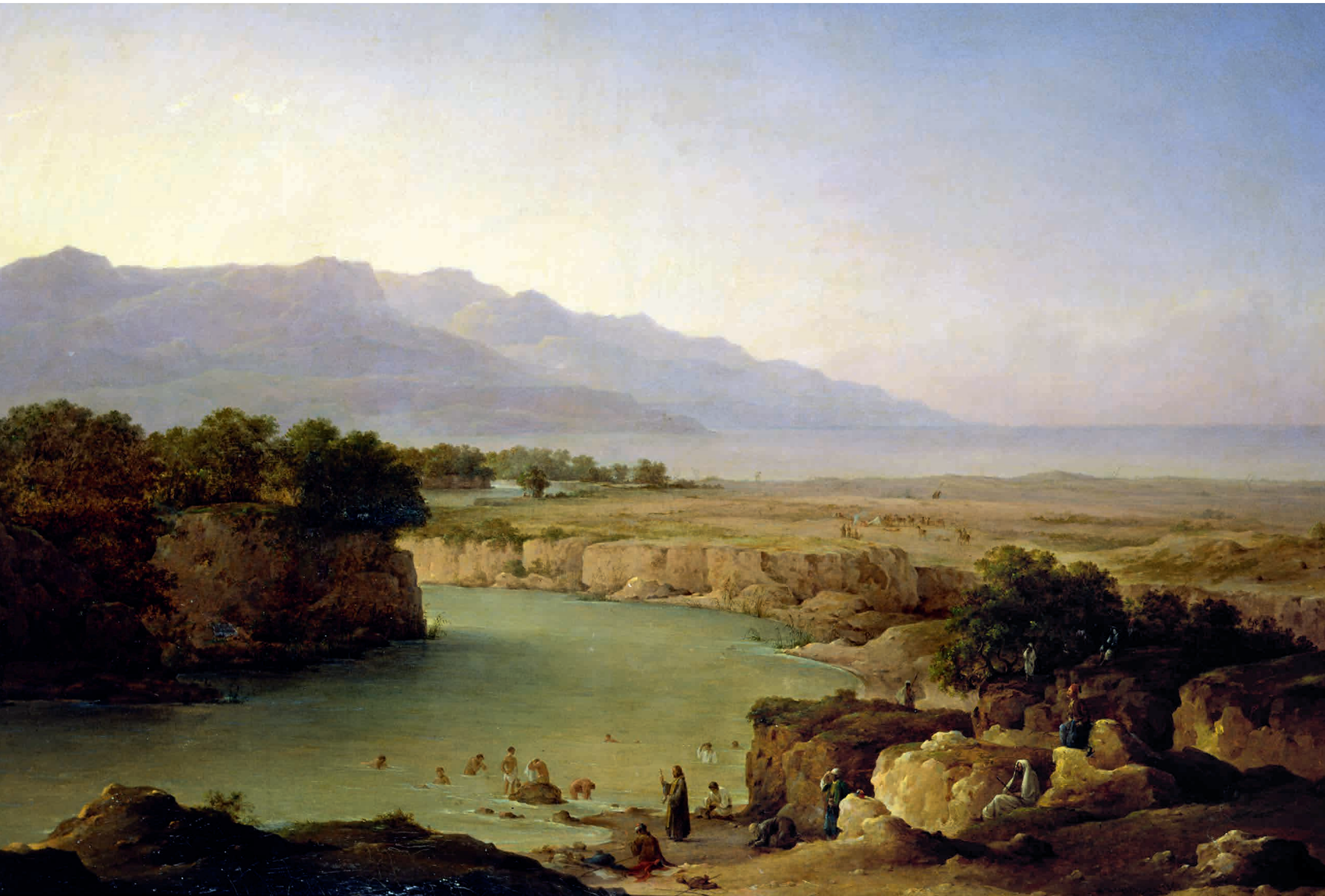
Вид реки Иордан при впадении в Мертвое море. Н. Г. Чернецов. 1854