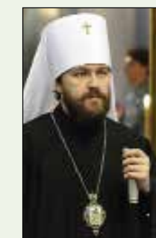
Иларион, митрополит Волоколамский, председатель Редакционного совета «Журнала Московской Патриархии»

Сердечно поздравляю всех читателей с наступающим Рождеством Христовым! Мир Божий да преисполнит наши сердца!