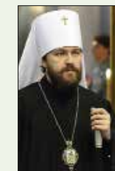
Иларион, митрополит Волоколамский, председатель Редакционного совета «Журнала Московской Патриархии»