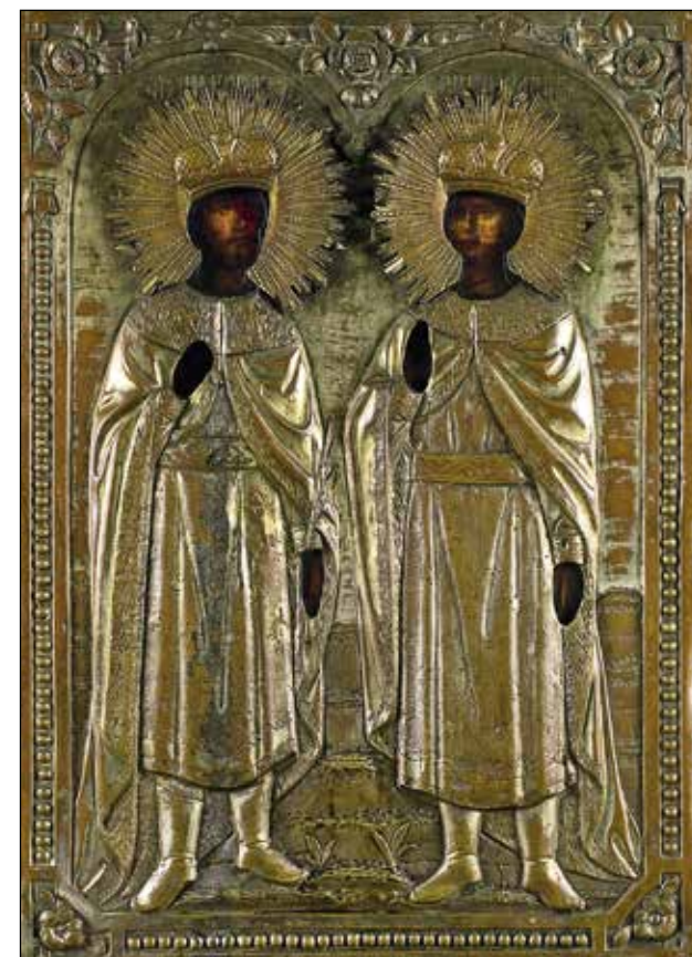
Протоиерей Александр Балыбердин