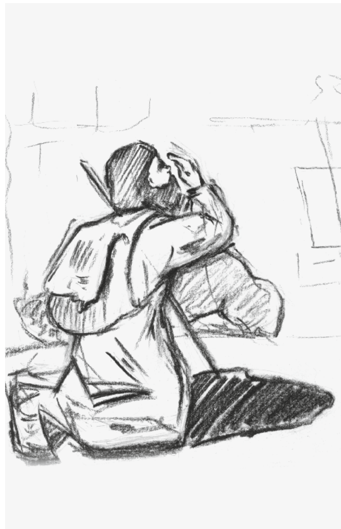
Рисунок В. Ф. Войно-Ясенецкого. 1890-е

Тогда Валентин написал письмо учителю с просьбой повлиять на мать, с тем чтобы она отпустила его в народ... Но ответа он не дождался, а вскоре увлечение толстовством рухнуло: в руках Валентина оказалась изданная за границей книжица Толстого «В чём моя