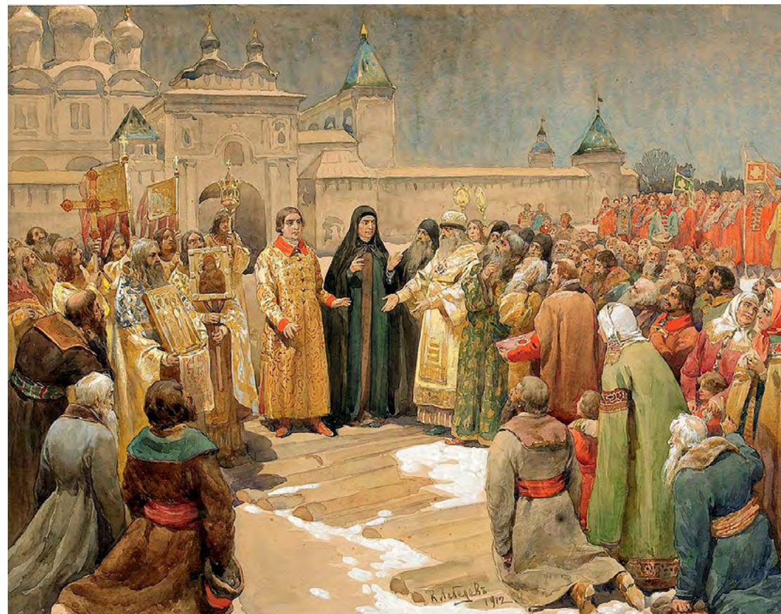
Избрание Михаила Романова в 1613 году. К. В. Лебедев

Мы знаем, что в течение трехсот лет правления династии Романовых из небольшого государства страна наша стала великой державой — от Балтийского моря до Тихого океана. Россия, особенно в годы правления Государя Императора Николая II, до начала Первой мировой войны, явила чудеса экономического, социального и политического развития. В ближайшие десятилетия Россия могла стать лидером всего мира,