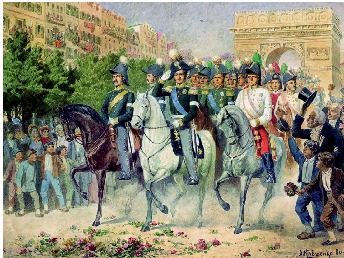
Вступление русских и союзных войск в Париж. А. Д. Кившенко

И этот Государь был убит террористами — так уже тогда проявилось противостояние между