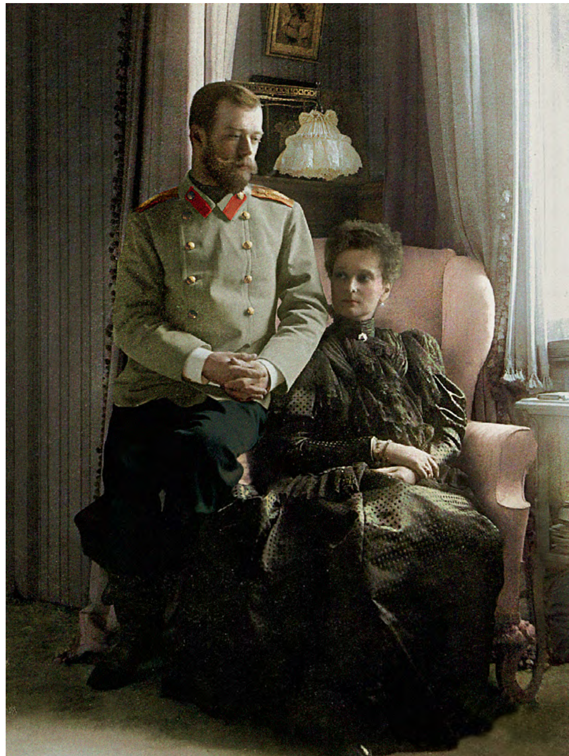
Государь Император Николай II с супругой Государыней Императрицей Александрой Феодоровной. Около 1899 г.

Ярким примером христианской семьи является Семья Царственных страстотерпцев. Святые