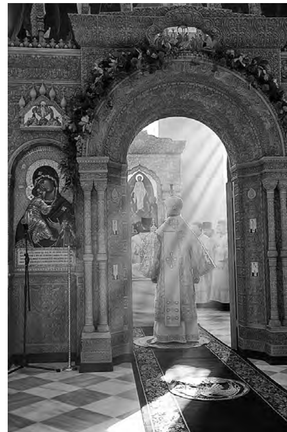
Невозможно научно доказать или опровергнуть бытие Божие. Ибо это есть предмет веры

Общепризнанным в богословии является утверждение о присутствии в каждом человеке религиозного чувства. Религиозное чувство присуще человеческой природе так же, как, к примеру, музыкальный слух. Этим чувством обладает каждый человек. Когда религиозное чувство в нем возгрето, когда оно активно, то человек верует, когда же оно пребывает в бездействии — не верует.