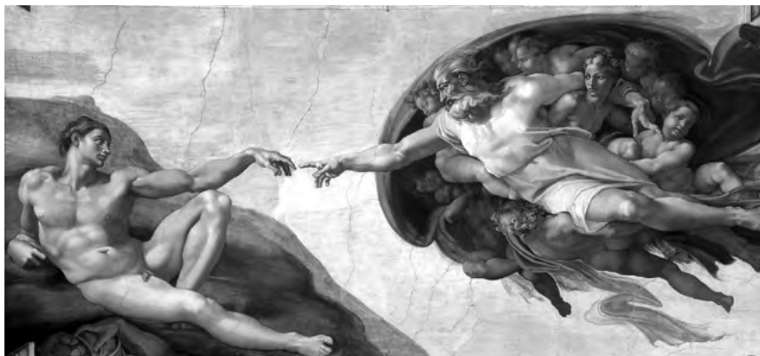
Сотворение Адама. Микеланджело Буонарроти. Около 1511 г.

Бог открывал Себя. Но во всей полноте Он открыл Себя в Иисусе Христе, родившемся две тысячи лет назад в иудейском городе Вифлееме. Во Христе миру была дана полнота Откровения.