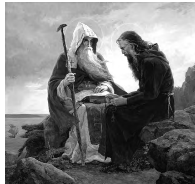
Преподобные Антоний и Феодосий Киево-Печерские. Сайда Афонина. 1995 г.

Итак, одни люди верят, другие не верят. Такова реальность, которую следует глубоко осмыслить. Некоторые не верят потому, что у них не развито религиозное чувство. Другие не могут поверить из-за того, что их нравственное чувст-