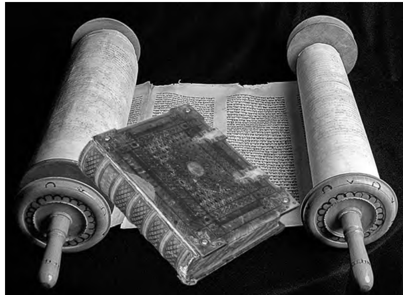
Первоначально библейские тексты были записаны на древнееврейском языке, затем были переведены на греческий, латынь, славянский и другие языки народов мира

Есть и еще одна трудность, с которой сталкивается современный читатель Библии. Зачастую люди пытаются рассматривать Библию как источник естественнонаучных данных. Открывают первые главы книги, где говорится