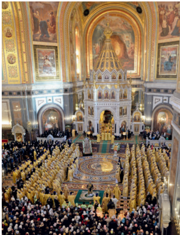
Празднование годовщины интронизации. 2015 год

Сегодня хранить православную веру, как ее хранил Марк Эфесский, означает не терять способность прилагать Божественные критерии к тому, что происходит в наше время. Почему многие западные христиане так подвержены влиянию внешних сил? Стоит парламенту принять закон о допустимости однополюсных союзов, как протестантские общины немедленно принимают это как часть своей внутренней жизни