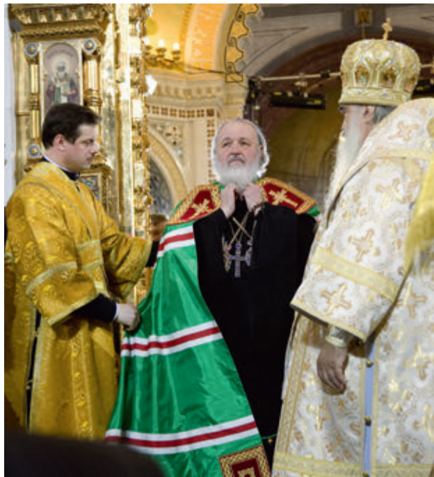
В день интронизации 1 февраля 2009 года

Мы вступаем в период подготовки к Великому посту. И совершенно неслучайно, что первые шаги на пути к посту связаны с желанием каждого человека, и это закономерно, подумать о своей внутренней жизни. И Евангельское чтение о мытаре и фарисее (см.: Лк. 18, 10–14) помогает нам понять, в каком направлении мы должны эти мысли о себе развивать.