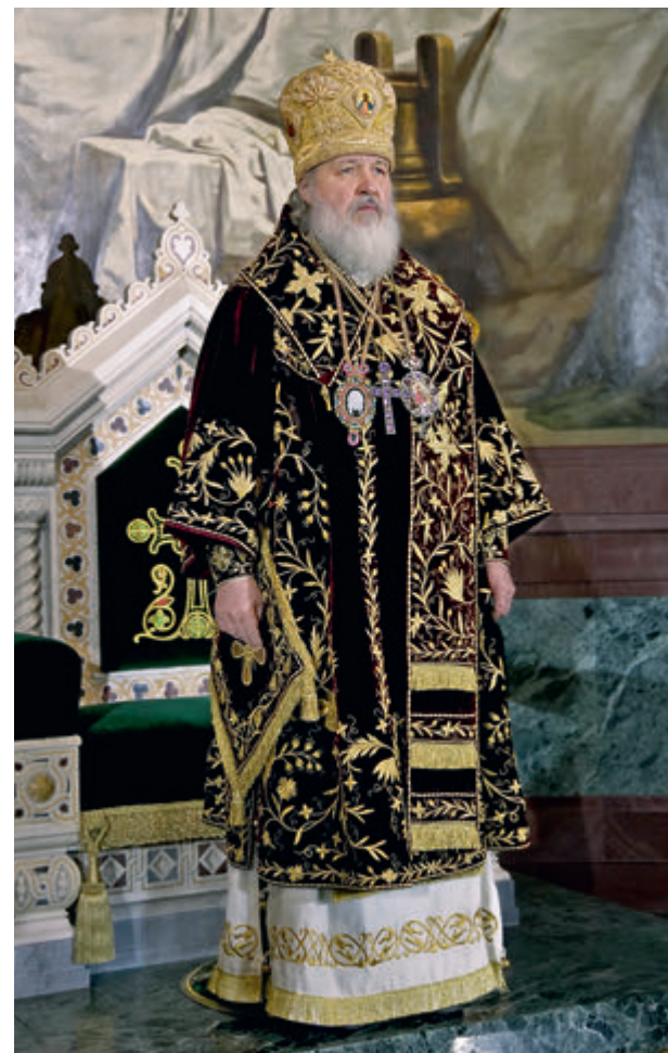
Святейший Патриарх Московский и всея Руси Кирилл Интронизация 1 февраля 2009 года

Как сейчас помню тот день и душевный трепет, с которым взшел я через главный, западный вход в этот благолепный храм к предстоящему мне патриаршему служению. Помню мысли, которые обуревали меня в тот день, торжественную и радостную атмосферу, множество людей, которые пришли поздравить Патриарха. Взирая на те светлые лица, я, конечно, испытывал добрые, теплые, глубокие чувства, но одновременно, думая о том, что на горнем месте, на архиерейской кафедре на меня был возложен великий параман, создавал, что это не просто символическое деяние и не просто часть патриаршего богослужебного ритуала, но нечто большее. Это – Божественное