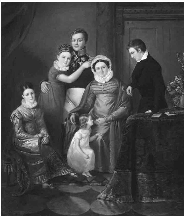
Семейный портрет графа Николая Григорьевича Репнина-Волконского Неизвестный художник. 1820-е

Моя новая экипировка заставила меня несколько отложить этот момент. Разного рода расходы на инструменты (довольно полный набор для хирургических операций и глазные инструменты), холсты, одежду и книги достигли девятисот венских гульденов. У меня