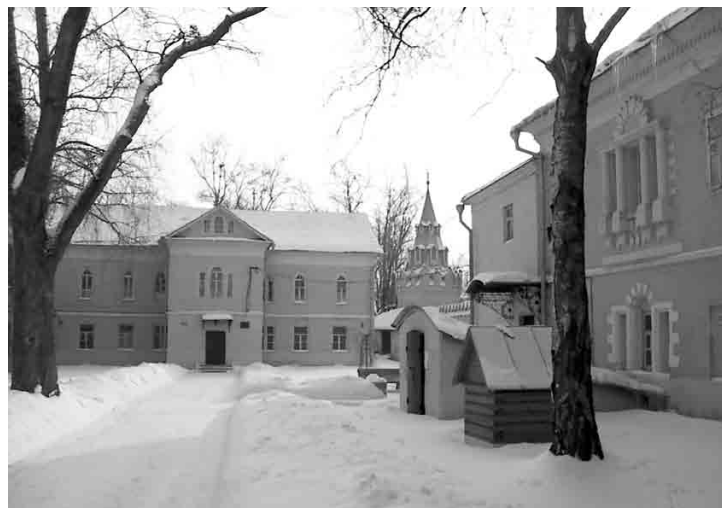
Преображенский богаделенный дом

В 1809 и 1810 годах Федор Петрович Гааз, с трудом получив разрешение, совершил две