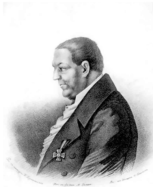
Портрет доктора Ф.П. Гааза

Спустя некоторое время Федору Петровичу пришлось поступить на службу, чтобы упорядочить весьма запущенные дела в запасной аптеке московской медицинской конторы. Князь Дми-