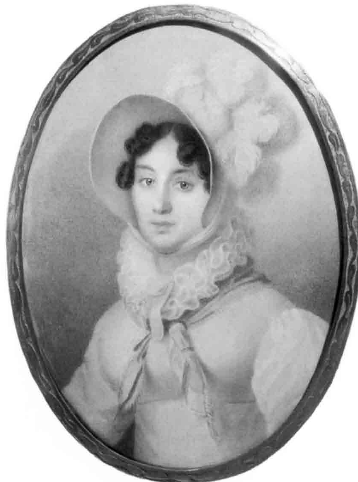
Княгиня Варвара Алексеевна Репнина-Волконская. Ж.-А. Беннер. 1817

Поскольку из копии контракта все условия Вам известны, я полагаю, что об этом все уже сказано. Одно, что должен был бы я сделать раньше, приходится мне теперь наверстать, и я делаю это от всей души, дорогой дядя, и очень прошу Вас и моих милых родителей, сестер и братьев простить мне, что так долго не сообщал ничего о себе. Что я поправился от своей болезни, Вы можете заключить и сами. О своих прочих обстоятельствах я не мог ничего Вам сказать, так как каждую минуту ждал решений. Теперь давайте забудем обо всем этом. Я бесконечно счастлив, что, нуждаясь до сих пор в поддержке моей семьи, я достиг теперь положения, когда смогу отблагодарить Вас за все Ваши добрые жертвы так, как мне этого хотелось.