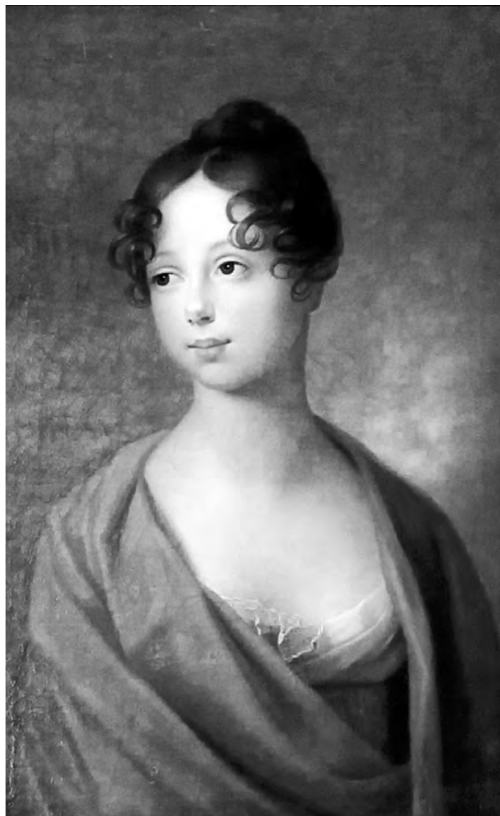
Великая княжна Екатерина Павловна. Иоганн Фридрих Август Тишбейн. 1805 г.

Руки Екатерины Павловны искали многие, даже французский император Наполеон Бонапарт, желая укрепить союз с Россией, сделал ей предложение, однако она ему отказала. Высокообразованная, волевая, бесстрашная, умная,