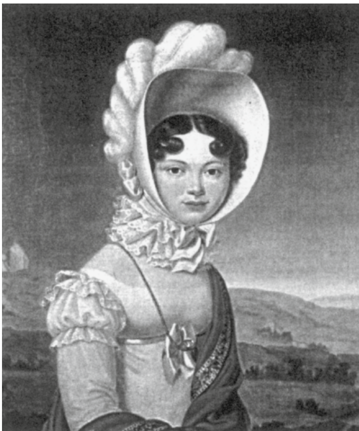
Портрет великой княгини Екатерины Павловны. Анри-Франсуа Ризенер. 1813 г.

несчастливого человечества, именно: от честолюбия и самолюбия».