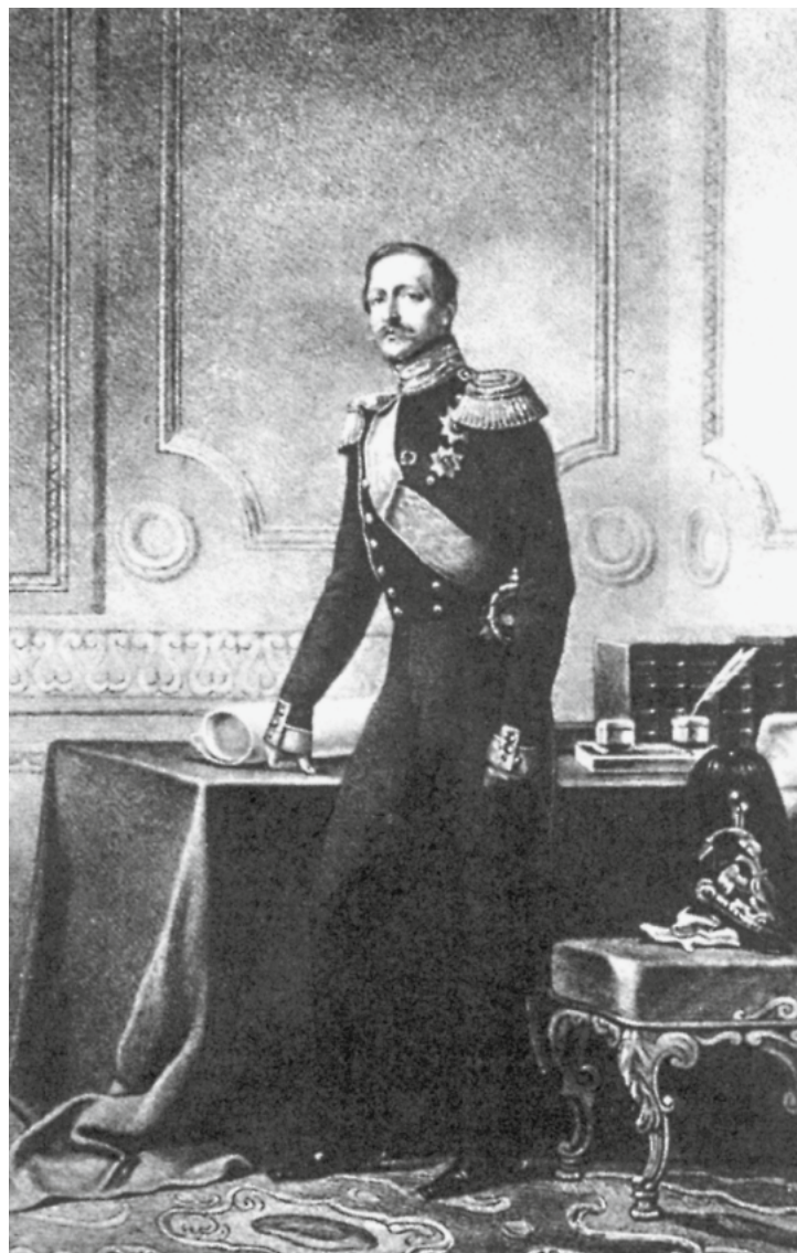
Портрет принца Петра Георгиевича Ольденбургского. Литография А. А. Козлова. Конец 1850-х — начало 1860-х гг.