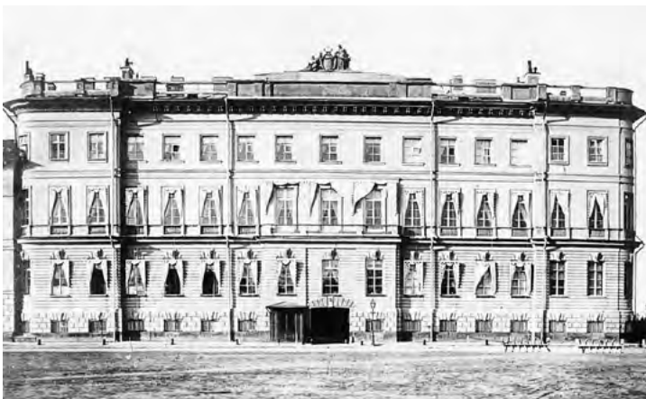
Дом Бецкого — Дворец принца Ольденбургского. 1865–1870 гг.

линии он был правнуком императрицы Екатерины Великой и внуком государя Павла Петровича. Принц Петр Ольденбургский спешил в Санкт-Петербург, куда его вызвал для прохождения государственной службы дядя, император Николай Павлович, которому поручила попечение о своих внуках и детях его сестры, великой княгини Екатерины Павловны, мать-императрица Мария Федоровна.