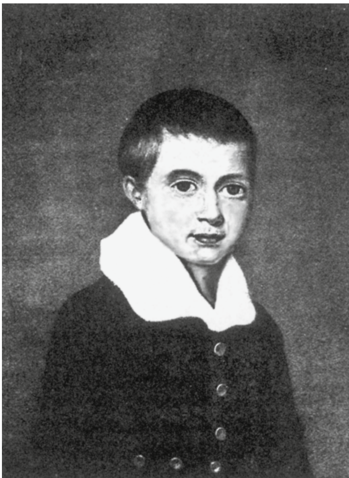
Принц Петр в возрасте восьми лет

бедного человека. Весь успех дела зависит от того личного и живого участия, которое внесет каждый член благотворительного общества».