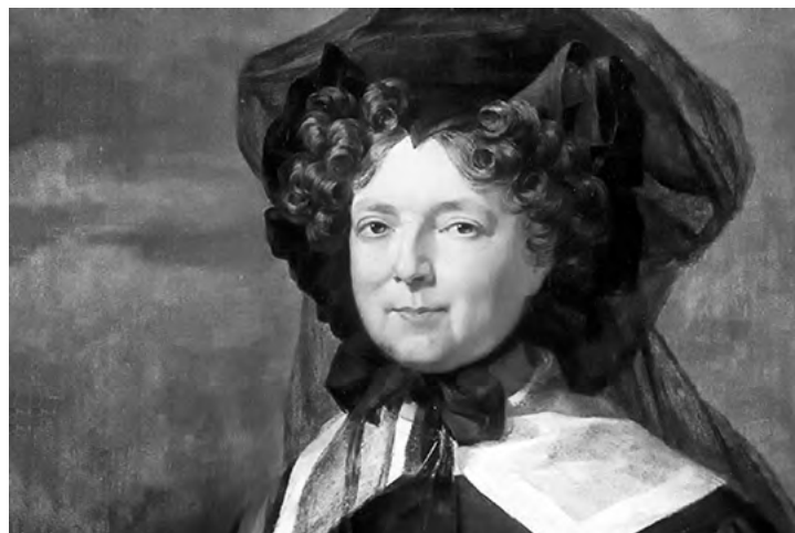
Фрагмент картины «Портрет императрицы Марии Федоровны в трауре». Джордж Доу

Во время войны с Наполеоном Бонапартом принц Георг и его супруга великая княгиня Екатерина Павловна формировали ополчение в своих губерниях, устраивали лазареты,