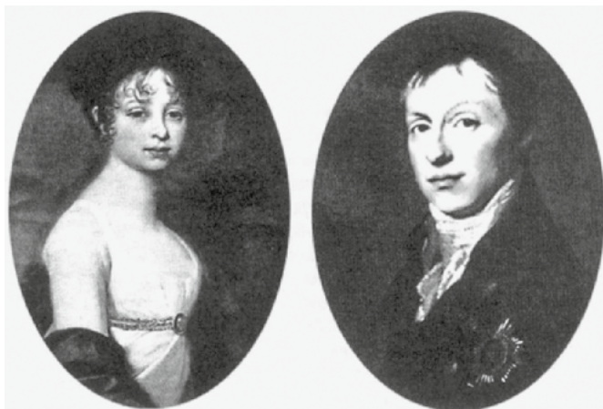
Великая княжна Екатерина Павловна.