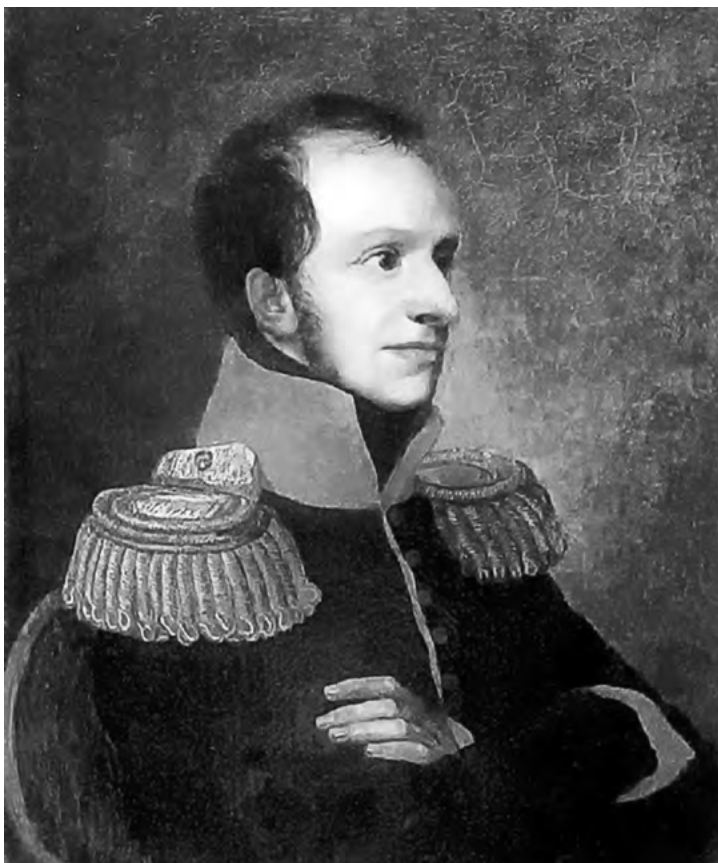
Портрет принца Г. П. Ольденбургского. О. А. Кипренский. 1811 г.

(назначаемые виновным) в докладах должны быть отмечаемы прописью, а отнюдь не цифрами, и упаси Боже прибавить лишний».