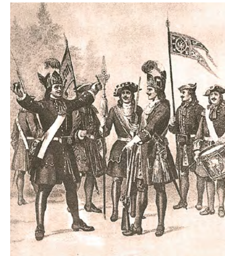
❖ Гренадер, обер-офицер, пикенер, барабанщик лейб-гвардии Преображенского полка 1700–1725 гг. Гравюра XIX в.