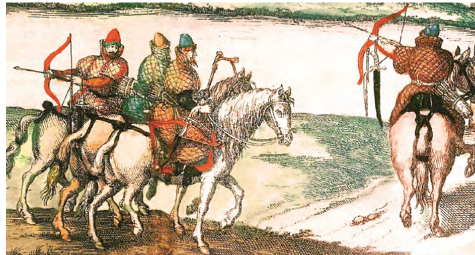
Гравюры из книги С. Герберштейна «Записки о Московии». 1549 г.

и других фамильных бумаг, с присовокуплением поколенной росписи предков князей Юсуповых с XVI века. СПб., 1866.