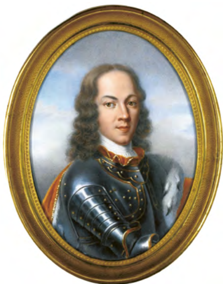
❖ Царевич Алексей Петрович

древках, под которым шествовала императрица в Успенский собор в Кремле.