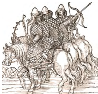
❖ Русская боярская конница. Гравюра из книги С. Герберштейна «Записки о Московии». 1549 г.