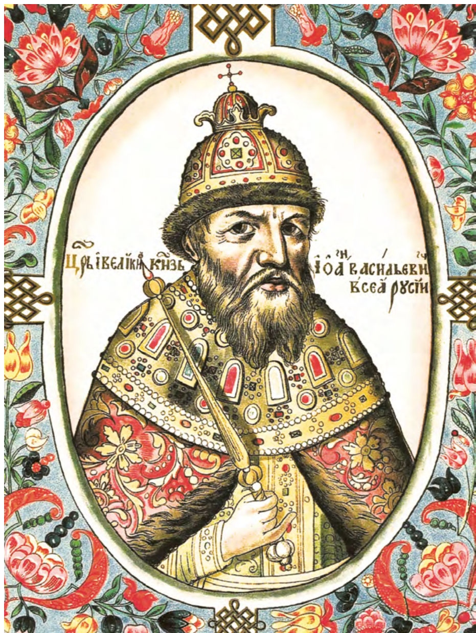
Царь Иоанн Васильевич (Иоанн IV). Из «Царского титулярника» Царя Алексея Михайловича. 1672 г.