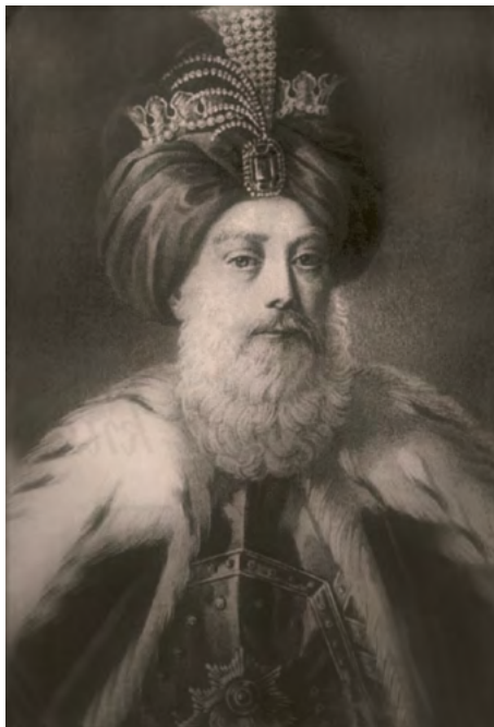
❖ Портрет хана Юсуфа. А.Г. Рокштуль. Начало 1850-х гг. (вымышленный портрет)

сам же Иль-мурза Юсупов послал самозванцу подарки: соболью шубу и лисью шапку.