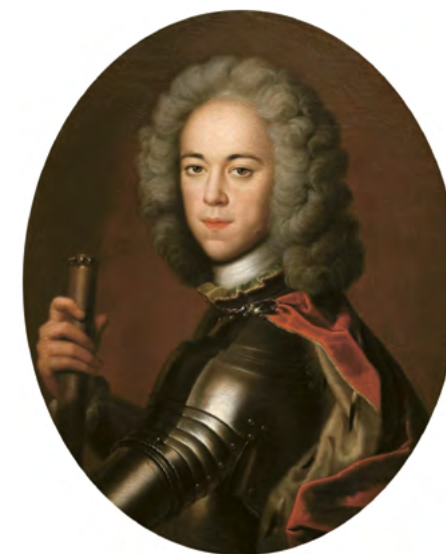
❖ Царевич Алексей Петрович

Светлейший князь Александр Данилович Меншиков объявил собравшимся высшим государственным чинам, что около четырнадцати лет они видели в Екатерине законную супругу своего