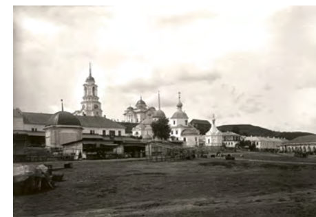
❖ Город Романов-Борисоглебск, пожалованный Ильмурзе Юсупову. Начало XX в.