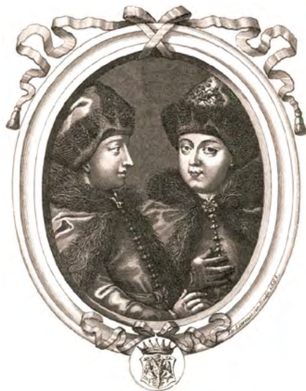
❖ Цари Иоанн и Петр Алексеевичи. Гравюра XVIII в.