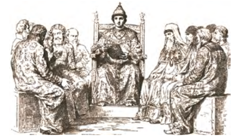
❖ Царь Феодор Алексеевич. В.П. Верещагин

На приступах к Азову князь Григорий получил свое первое воинское звание — был пожалован царем Петром в есаулы (помощник военачальника). После победы над турками князь Юсупов