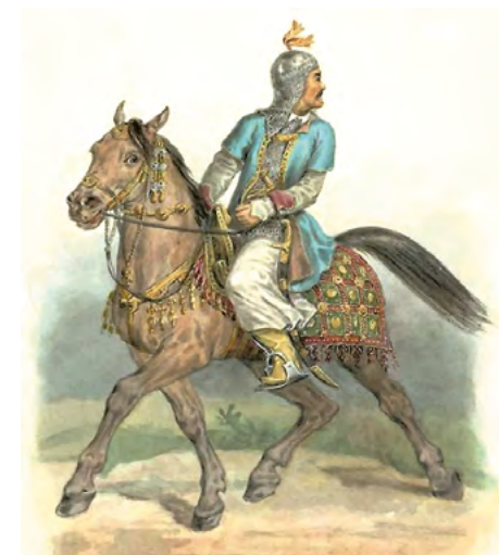
❖ Ногайский воин