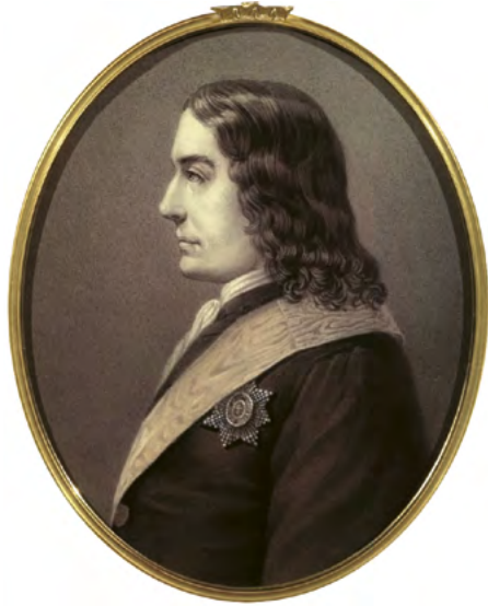
❖ Портрет князя Григория Дмитриевича Юсупова. А.П. Рокштуль

торжественно въехал в Москву в составе царской свиты, после чего жизнь Григория Дмитриевича большей частью проходила не в семье, а в воинских занятиях и походах на западе и юге России, в отдалении от своего семейства. Дважды он участвовал в сражениях под Нарвой, под Канцами (русское название Ниеншанца), где вскоре возникла новая столица Петра, бился и на море при взятии шведского фрегата и галер.