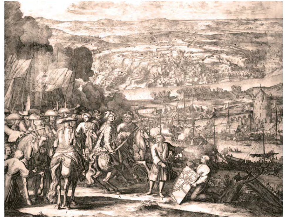
Осада турецкой крепости Азов русскими войсками в 1696 г. Гравюра А. Шхонебека

Когда в 1711 году в армии ощущался недостаток снабжения, Государь направил Григория Юсупова с отрядом драгунов в Польшу, в Познань, поручив ему заведовать сбором и доставкой провианта в действующую армию. Здесь ему довелось служить под началом знаменитого Александра Даниловича Меншикова и показать