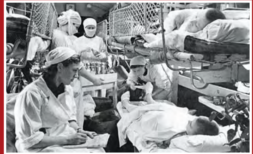
Медики возле раненых бойцов в вагоне военно-санитарного поезда № 72, выполняющего рейс Житомир—Челябинск, 1944 г.