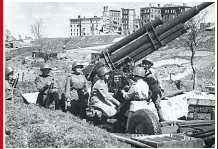
Зенитчицы на Казанской горе в освобожденном Смоленске, май 1944 г.