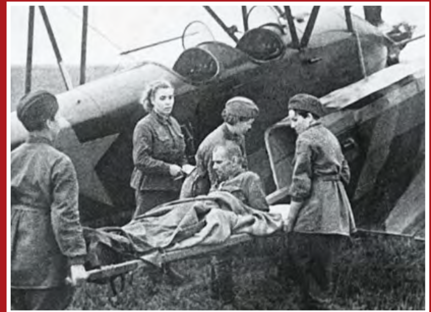
Эвакуация раненого бойца на самолете У-2, сентябрь 1941 г.