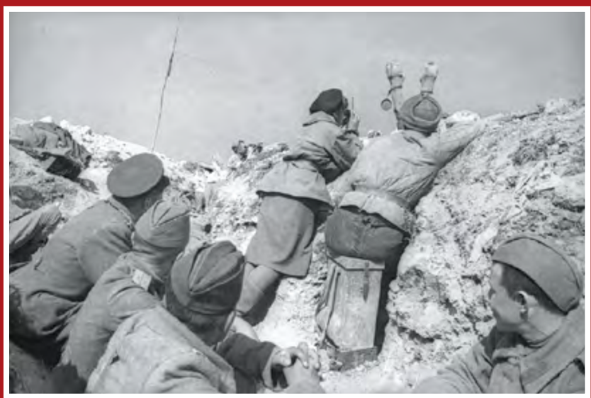
На пути к Берлину. На командном пункте, апрель 1945 г.