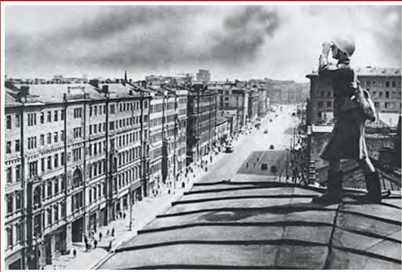
Боец войск противовоздушной обороны несет дежурство на крыше дома по улице Горького. Москва, июнь 1941 г.