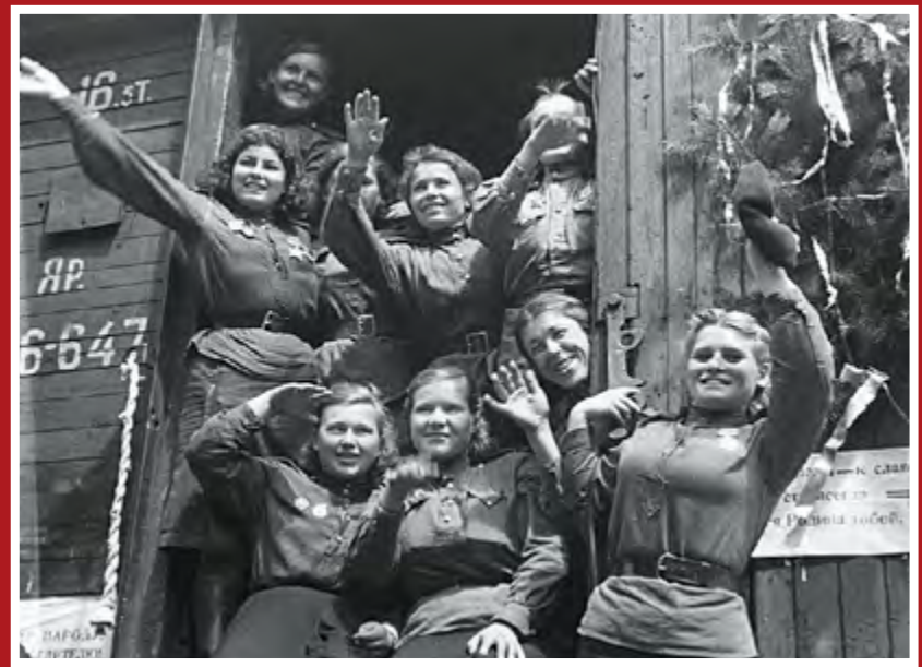
Девушки-бойцы возвращаются на Родину. Берлин, Германия, август 1945 г.