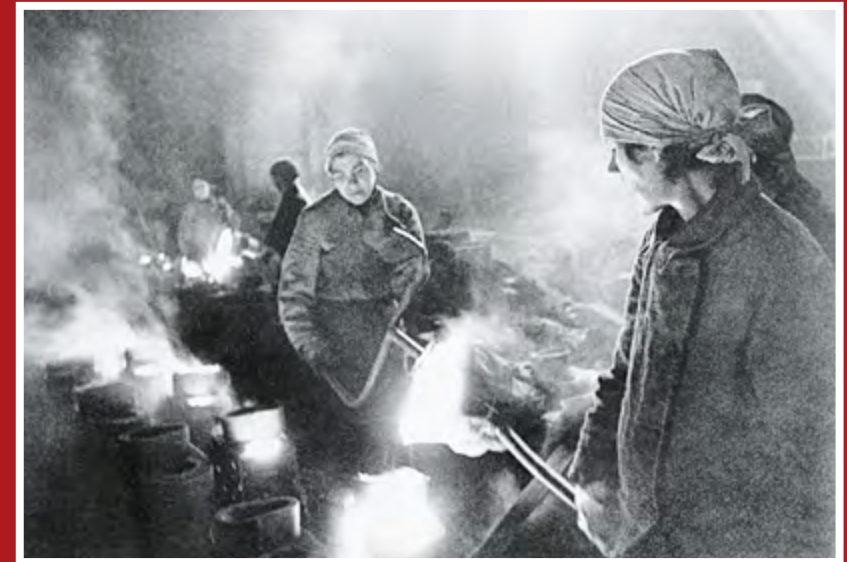
Литейщицы Машиностроительного завода им. Карла Маркса. Ленинград, 1942 г.