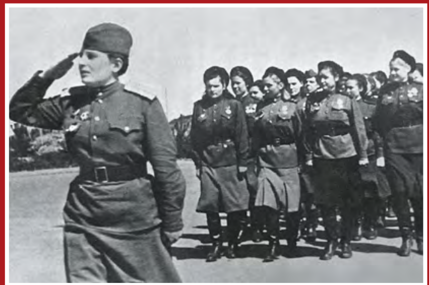
На параде Победителей. Кёнигсберг, Германия, 1 мая 1945 г.