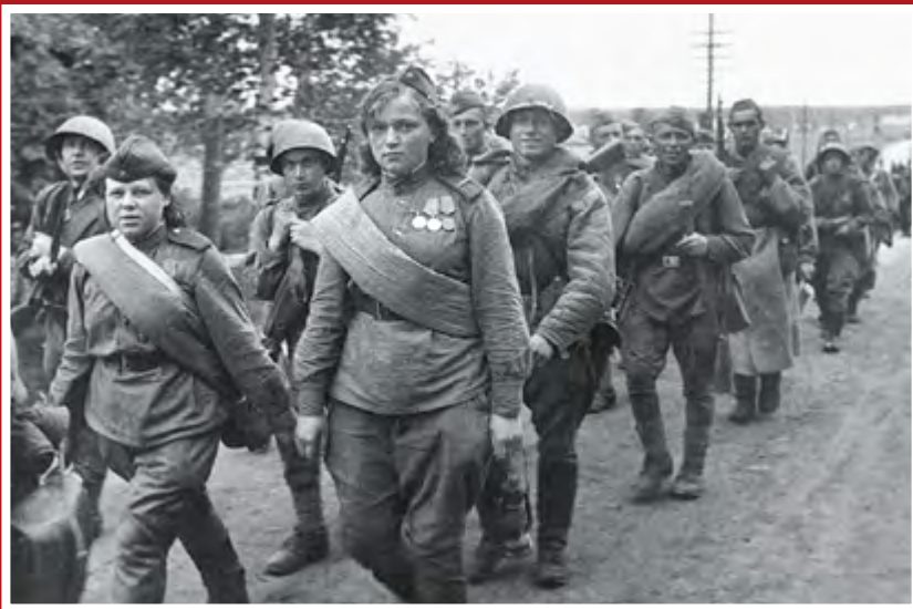
Красноармейцы Ленинградского фронта, июль 1944 г.