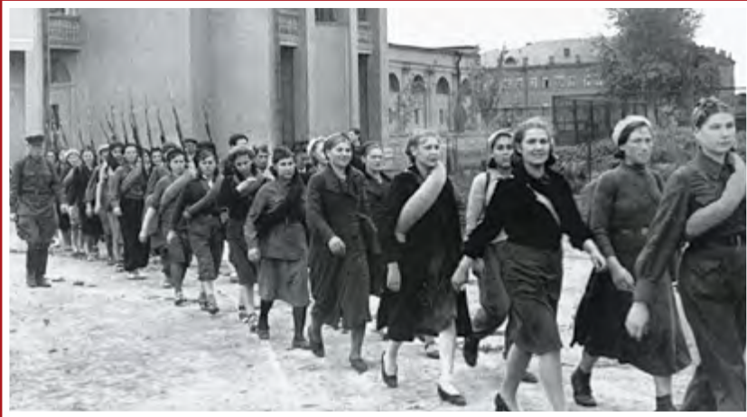
Бойцы всеобща идут по улице Москвы, сентябрь 1941 г.