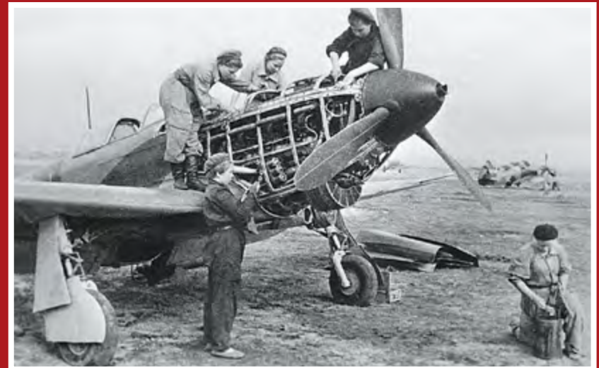
Техники 586-го истребительного авиационного полка готовят самолет Як-1 к полету. Украина, 1943 г.