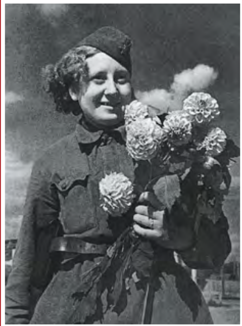
С фронтовым букетом