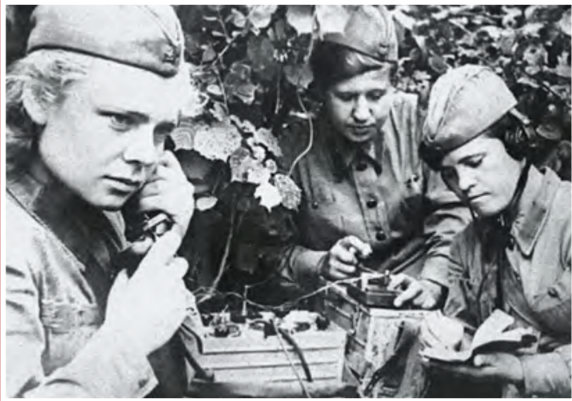
Радистки, 1942 г.