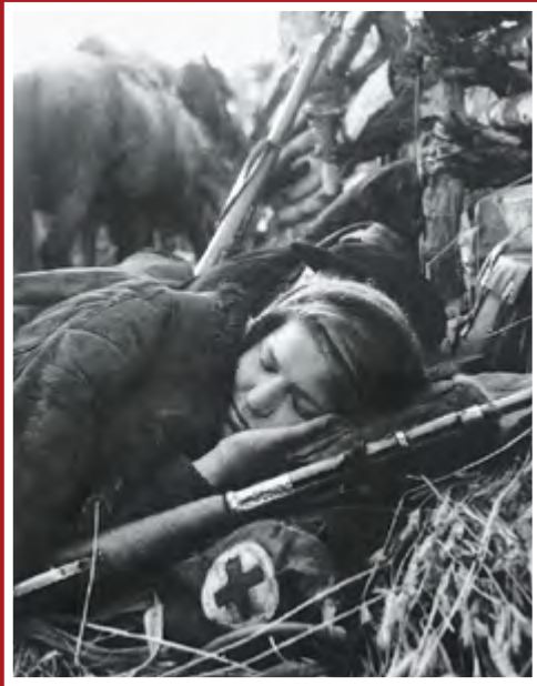
После тяжелой работы