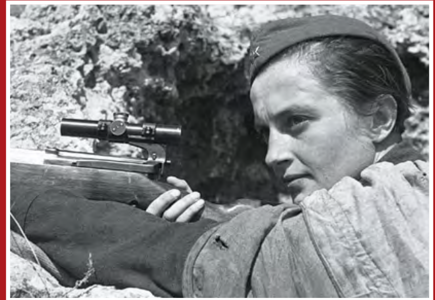
Снайпер Л. Павличенко. Севастополь, апрель 1942 г.