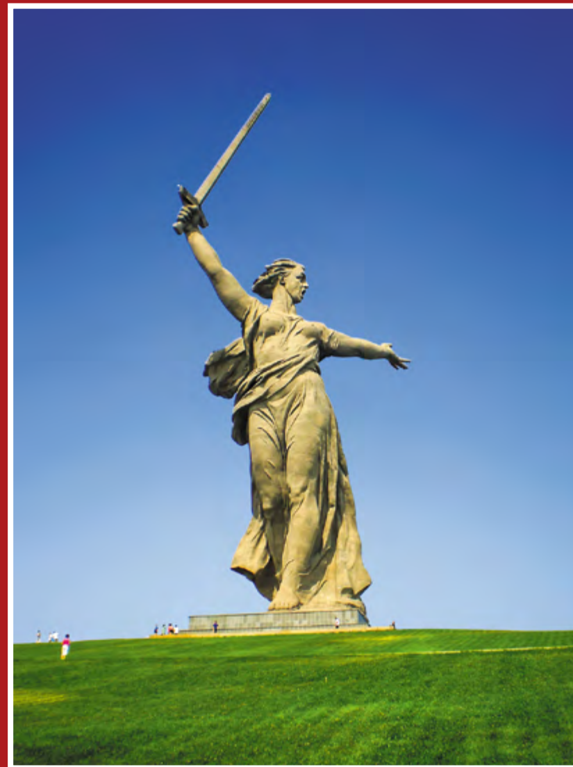
Скульптура «Родина-мать зовет!» Мамаев курган. Волгоград