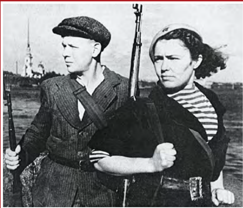
Бойцы всеобща на берегу Невы. Ленинград, сентябрь 1941 г.