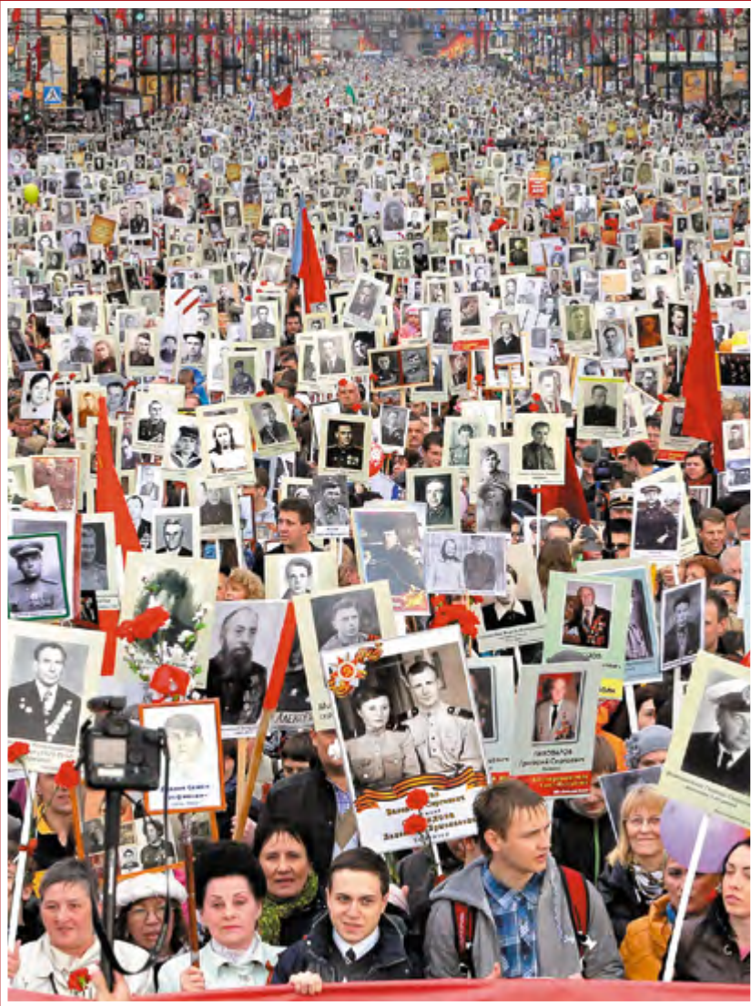
Шествие «Бессмертный полк» в Санкт-Петербурге, 9 мая 2014 г.

Вот, Господь Бог помогает Мне: кто осудит Меня?