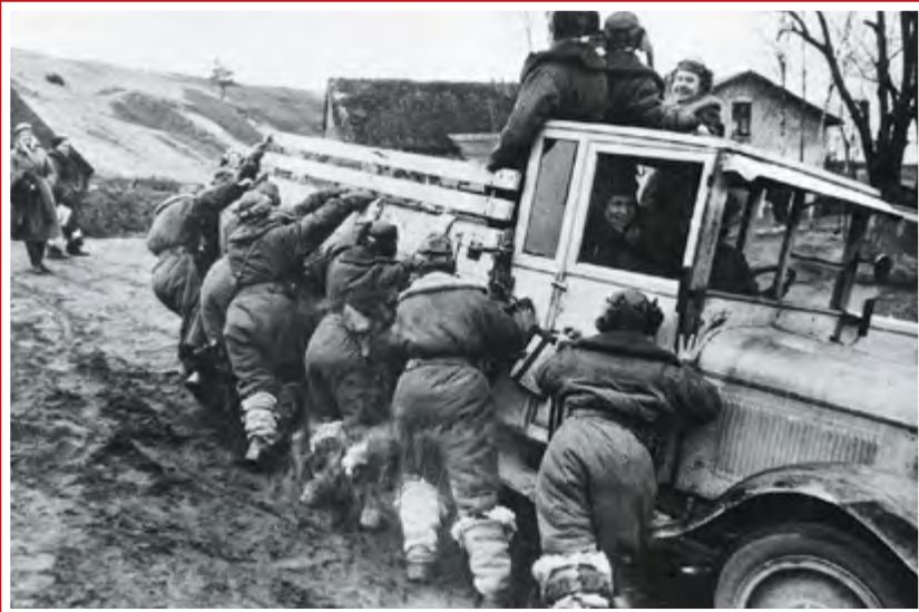
Марш-бросок. 46-й гвардейский ночной бомбардировочный авиационный полк под Керчью, 1943 г.