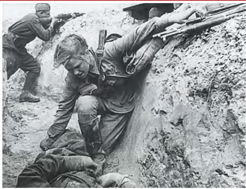
Девушка-санинструктор оказывает помощь бойцу под вражеским огнем