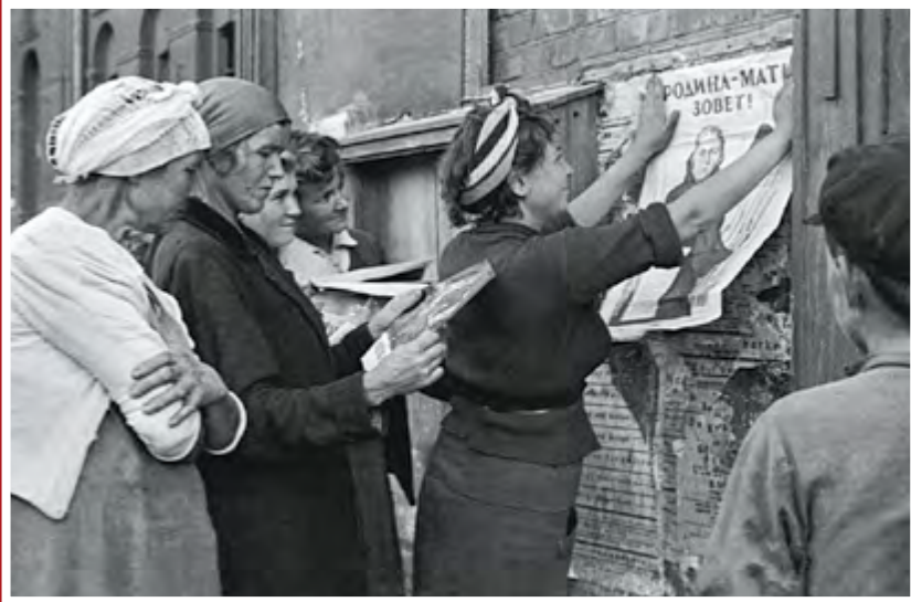
Расклейка плакатов «Родина-мать зовёт!», июль 1941 г.