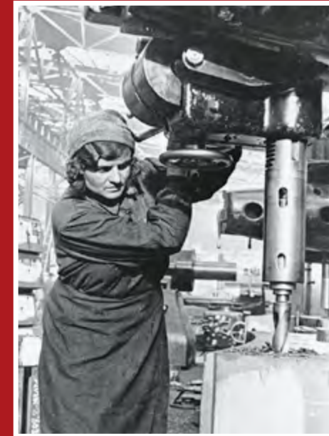
Работница военного завода у сверильного станка. Москва, 1941 г.