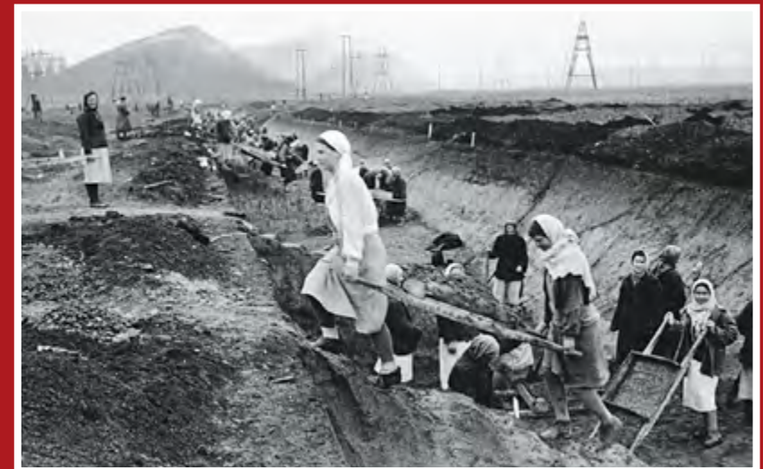
Сооружение противотанкового рва в Донецкой области. Украина, сентябрь 1941 г.