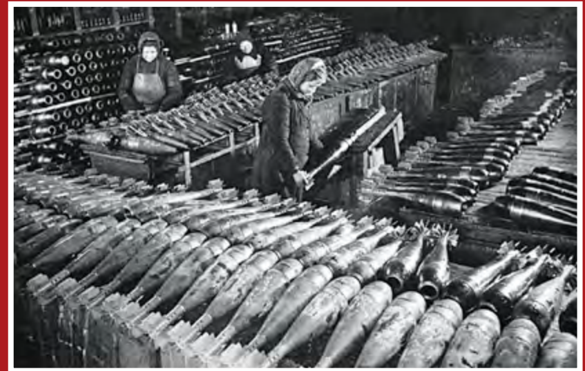
Снаряды, готовые для отправки на фронт. Москва, 1942 г.