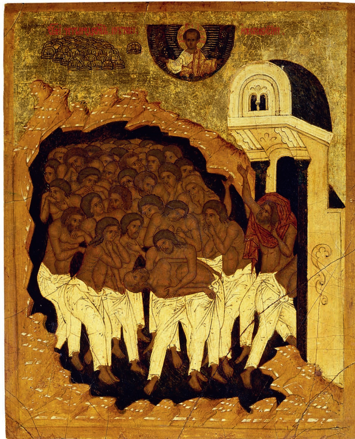
Сорок мучеников Севастийских Икона XV века