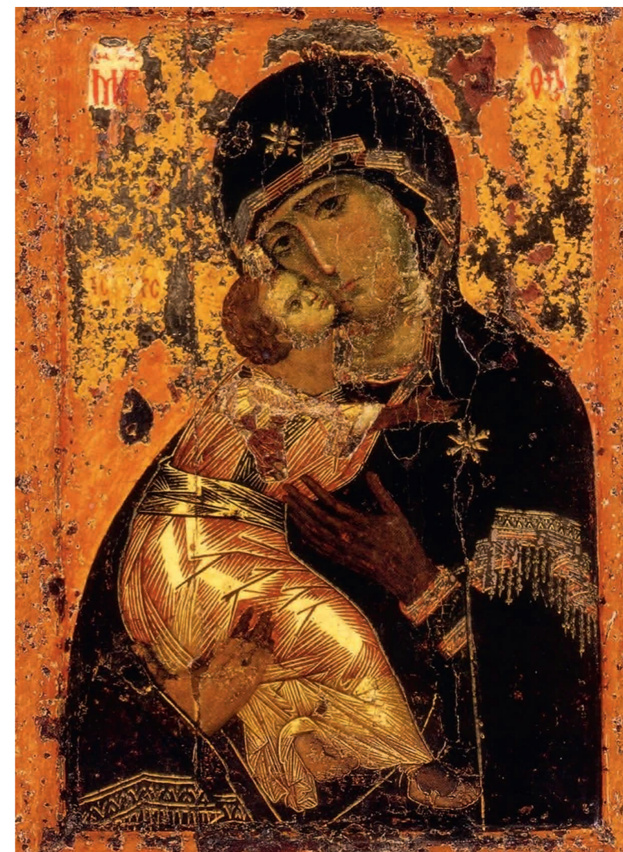
2 Икона, привезенная князем Андреем Боголюбским во Владимиро-Суздальские земли, получила название Владимирской.

Ты можешь могучую Волгу Разбрызгать веслами людей И вычерпать Дон многоводный Шеломами рати твоей.