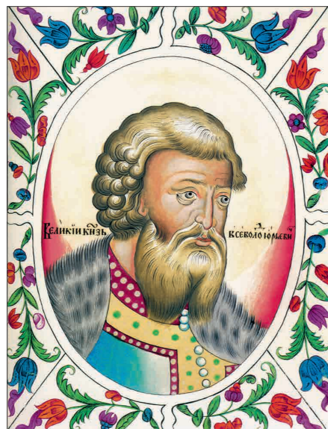
Великий князь Владимирский Всеволод III Большое Гнездо. Миниатюра из «Царского титулярника». 1672

Над Переяславлем радостно звонили колокола, отражаясь в незамутненных водах Клещина озера. В теплый майский день 1221 года у князя Ярослава родился сын! Вслед за первенцем Феодором появился на свет Александр.