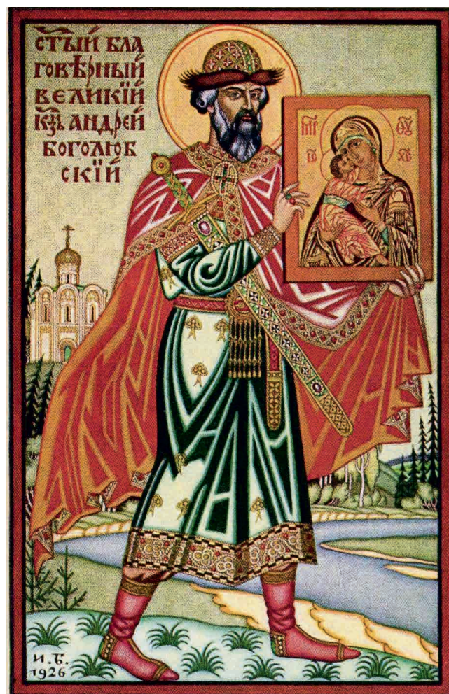
Князь Андрей Боголюбский с Владимирской иконой Божией Матери. И. Я. Билибин. 1926