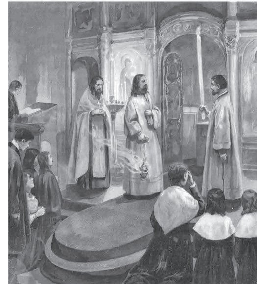
МАЛЫЙ ВХОД ЗА ВЕЧЕРНЕЙ