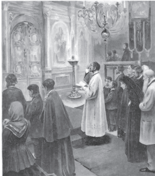
МАЛОЕ СЛАВОСЛОВИЕ И ШЕСТОПСАЛМИЕ

спасение Твое, еже еси уготовал пред лицом всех людей: свет во откровение языком, и славу людей Твоих Израиля (Ныне отпускаешь раба Твоего, Владыко, по слову Твоему, с миром, ибо видели очи мои спасение Твое, которое Ты уготовал пред лицом всех народов, свет к просвещению язычников и славу народа Твоего Израиля) и псалмом 33-м: Благословлю Господа на всякое время, выну хвала Его во устех моих. О Господе похвалится душа моя: да услышат кротцыи и возвеселятся. Возвеличите Господа со мною, и вознесем имя Его вкупе. Избавит Господь души раб Своих, и не прегрешат вси уповающие на Него (Благословлю Господа во всякое время; хвала Ему непрестанно в устах моих. Господом будет хвалиться душа моя; услышат кроткие и возвеселятся. Величайте Господа со мною, и превознесем имя Его вместе. Избавит Господь душу рабов Своих, и никто из уповающих на Него не погибнет).