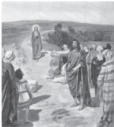
ЯВЛЕНИЕ ИИСУСА ХРИСТА НАРОДУ