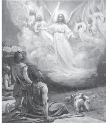
ВЕСТЬ О РОЖДЕНИИ СПАСИТЕЛЯ